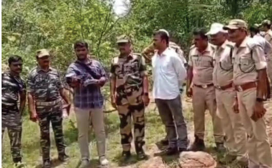
అనే రైతుకు చెందిన ఆవుపై పెద్దపులి